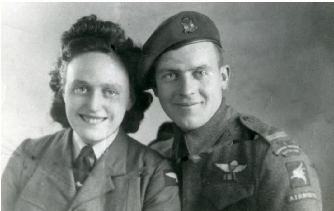
Violet en Gordon kerstmis 1944.

Elk bataljon moet in staat zijn de volgende test te doorstaan: een 80 km lange mars met volledige uitrusting binnen 18 uur. Het 1e Canadese bataljon legt dit op 19 november 1943 af. Daarna, tot april 1944, neemt het deel aan grote gevechtsoefeningen, waarbij een landing op de Franse kust wordt gesimuleerd. Op 24 mei 1944 verlaat het bataljon Bulford naar het doorgangskamp Down Ampney om zich gereed te maken voor D-Day.